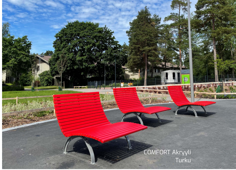
COMFORT Akryyli Turku