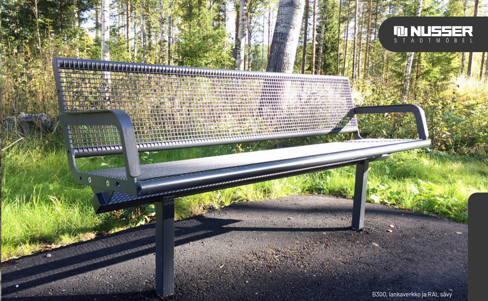
B300, lankaverkko ja RAL sävy