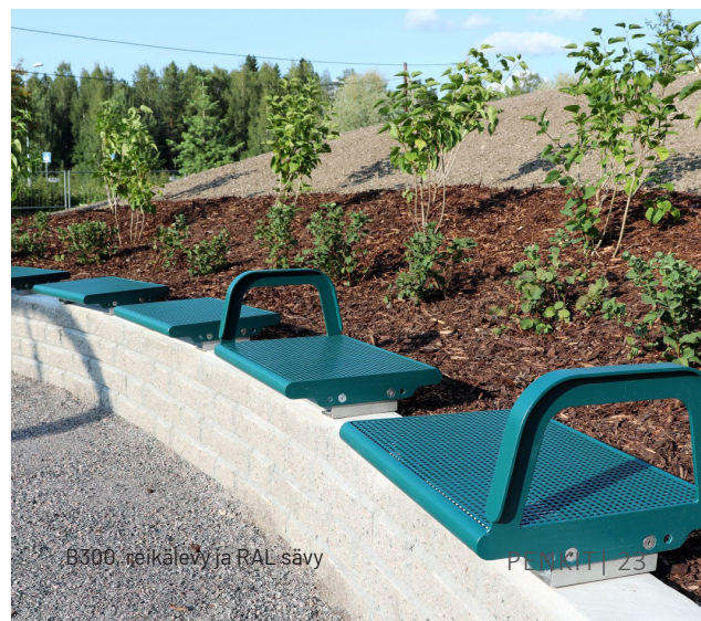
B300, reikälevy ja RAL-sävy