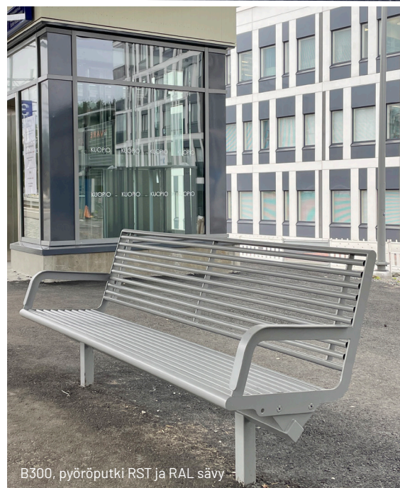
B300, pyöröputki RST ja RAL sävy