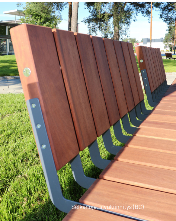
Selkänäjä, sivukiinnitys (BC)

ARENA suorat istuinelementit osittaisella selkänäjällä, pyöröputkijalat