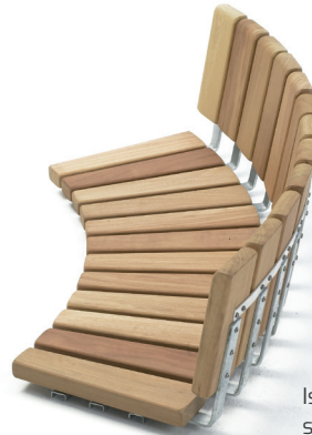
Istuinelementti ARENA selkänojalla (PS)