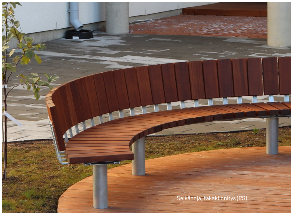
Selkänäjä, takakiinnitys (PS)