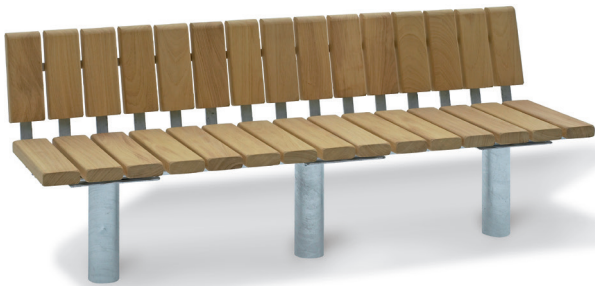
ARENA 200 suora selkänojalla (PS)