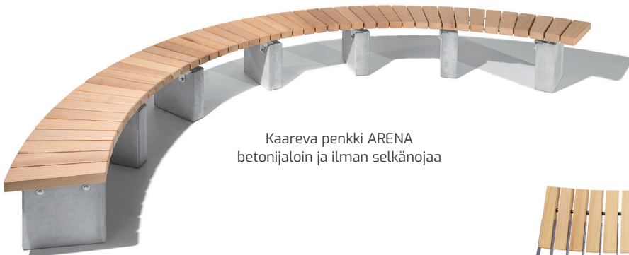
Kaareva penkki ARENA betonijaloin ja ilman selkänojaa