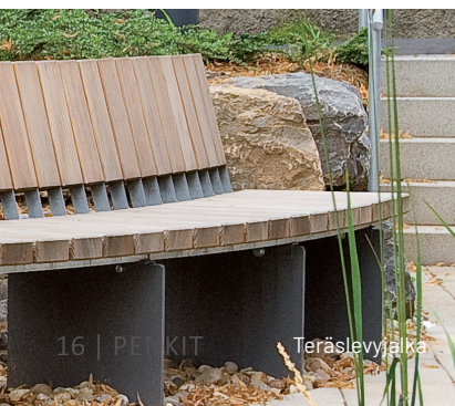
16 | PENKIT