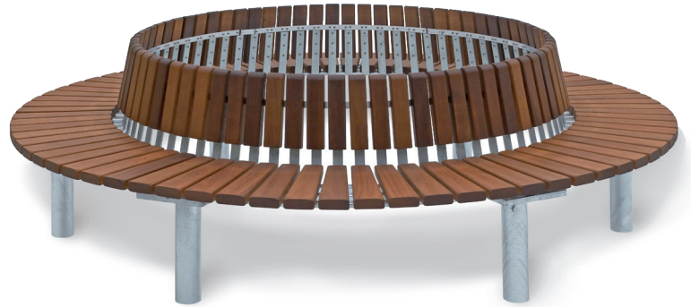
Ympyräpenkki ARENA pyöröputkijaloin ja selkänojalla (PS)