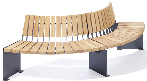
Kaareva penkki ARENA levyjälalla ja selkänojalla (BC)