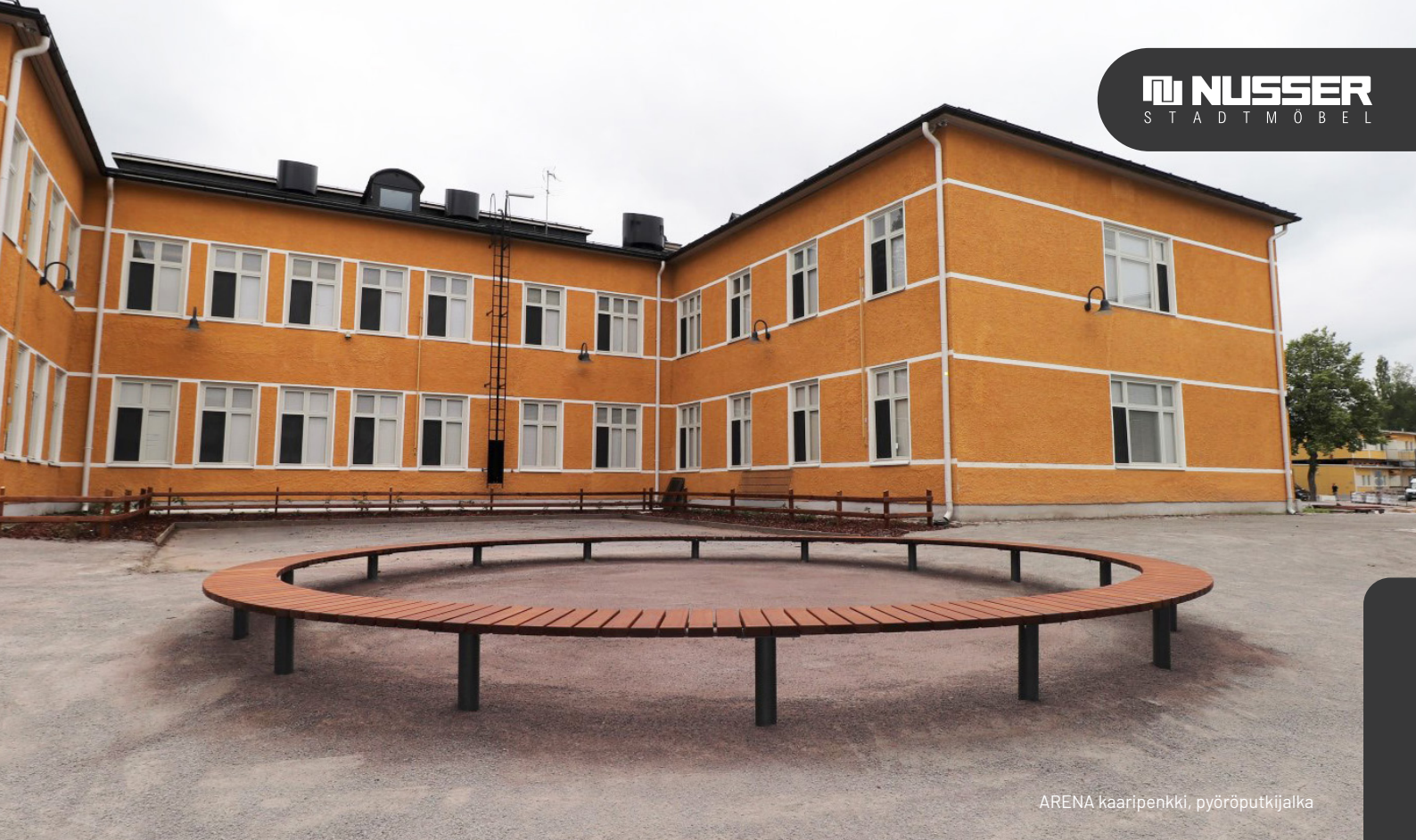
ARENA kaaripenkki, pyöröputkijalka