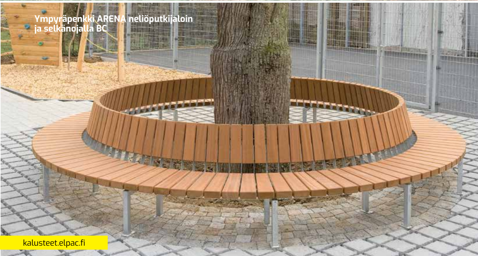
Ympyräpenkki ARENA neliöputkijaloin ja selkänojalla BC