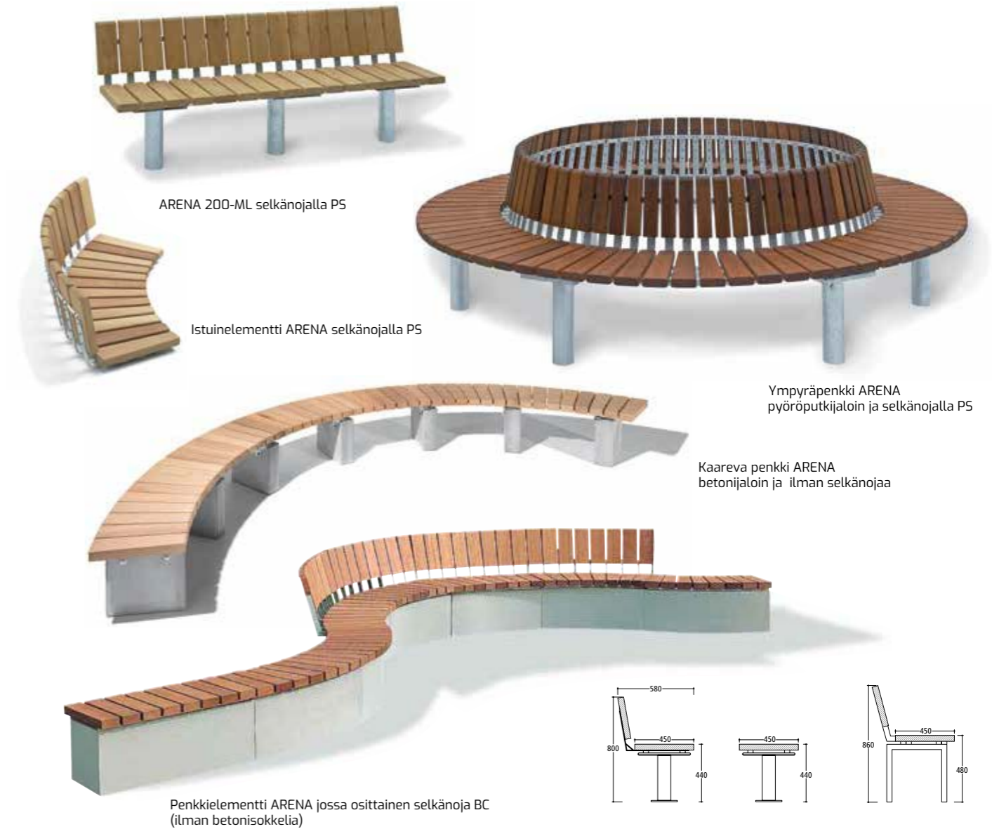
ARENA 200-ML selkänojalla PS