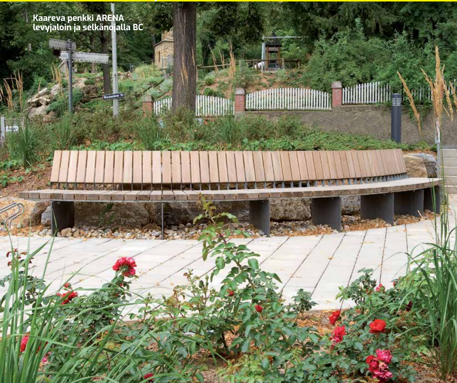
Kaareva penkki ARENA levyjaloin ja selkänojalla BC