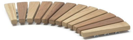
Istuinosa PS selkänojaton