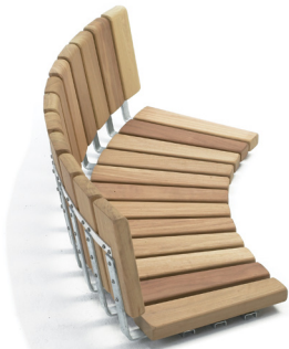
Istuinosa PS selkänojallinen